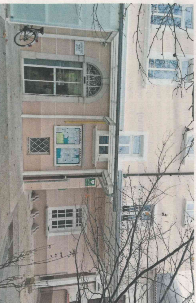
V ZD Ajdovščina zagotavljajo, da iščejo dodatnega zdravnika, župan s pojasnilom ni zadovoljen.